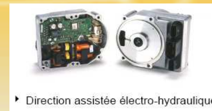
► Direction assistée électro-hydraulique